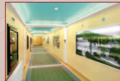
Corridor Via Imperialis