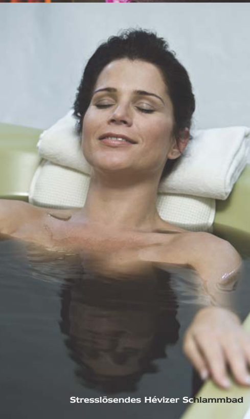
Stresslösendes Hévizser Schlammbad