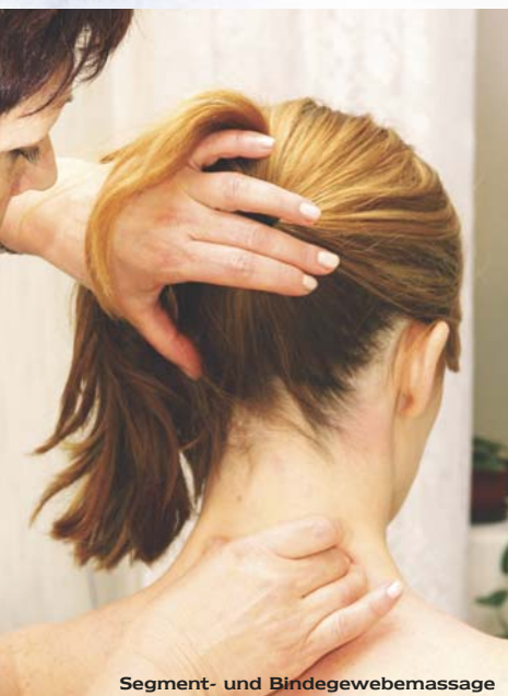
Segment- und Bindegewebemassage