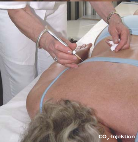
CO 2 -Injektion