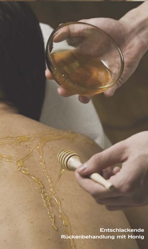
Entschlackende Rückenbehandlung mit Honig