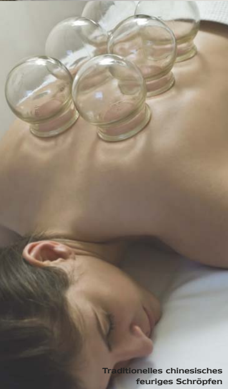
Traditionelles chinesisches feuriges Schröpfen