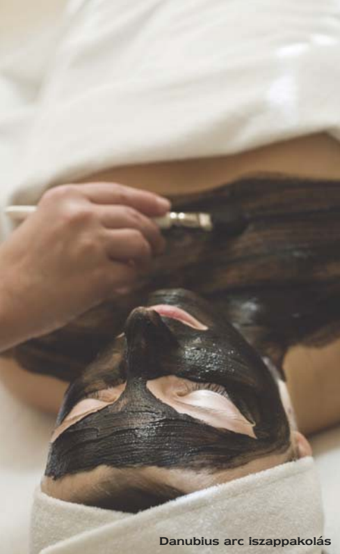
Danubius arc iszappakolás

testben, így erősítse az egészséget és életerőt, másik célja pedig a nyugodt elmeállapot létrehozása a thai chi gyakorlatokra való összpontosítás révén.