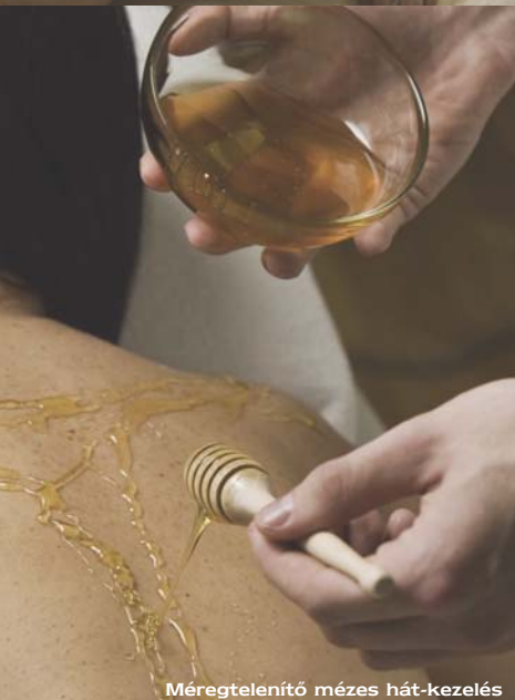
Méregtelenítő mézes hát-kezelés