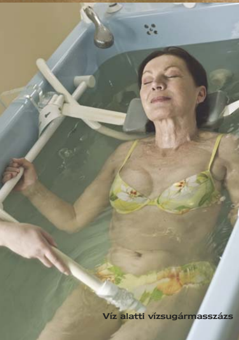
Víz alatti vízszugármasszázs