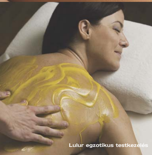
Lulur egzotikus testkezelés