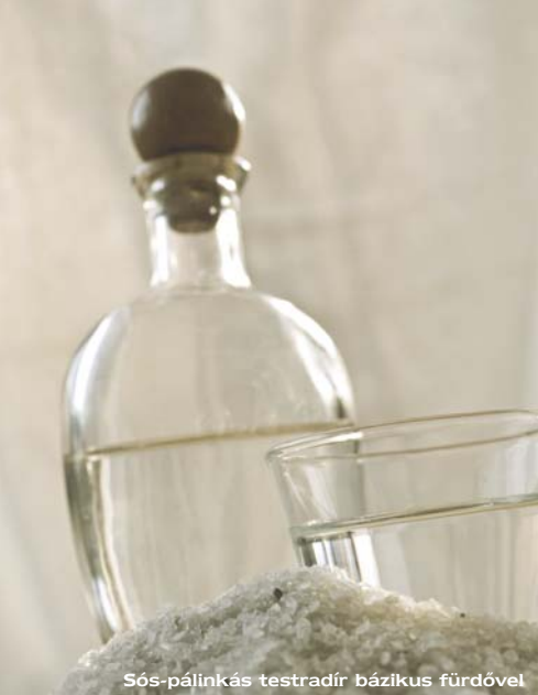
Sós-pálinkás testradír bázikus fürdővel