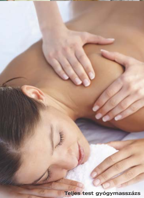
Teljes test gyógymasszázs