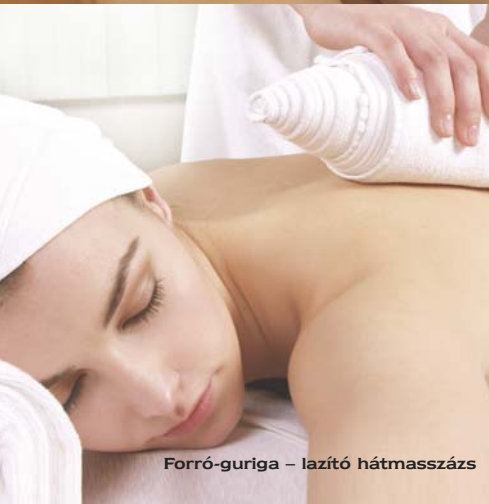
Forró-guriga – lazító hátmasszáz