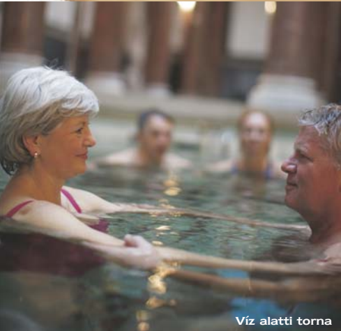
Víz alatti torna