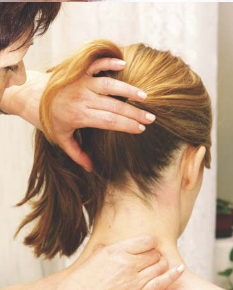
Szegment- és kötőszövetmasszázs