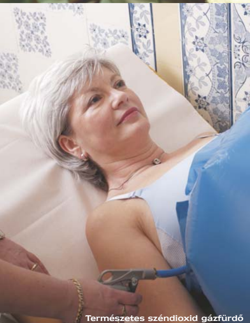
Természetes széndioxid gázfürdő

A sós fürdő a Romániában található szovátai gyógyszállodánk egyik jellemző kezelése. A vizet egy természetes sós tóból, a közvetlenül a gyógyfürdő alatt fekvő Medve-tóból nyerik. A Medve-tavat – melyben vizének kiemelkedően magas sótartalma miatt a fürdőzők szinte lebegnek – Erdély holt tengerének is nevezik. Nyáron a só elnyeli és megőrzi a meleget, így a kellemesen langyos, 30 °C hőmérsékletű víz csodálatosan pihentető, lebegő